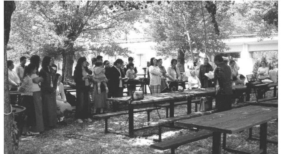
Uno dei momenti del culto tenutosi la mattina sotto gli alberi.